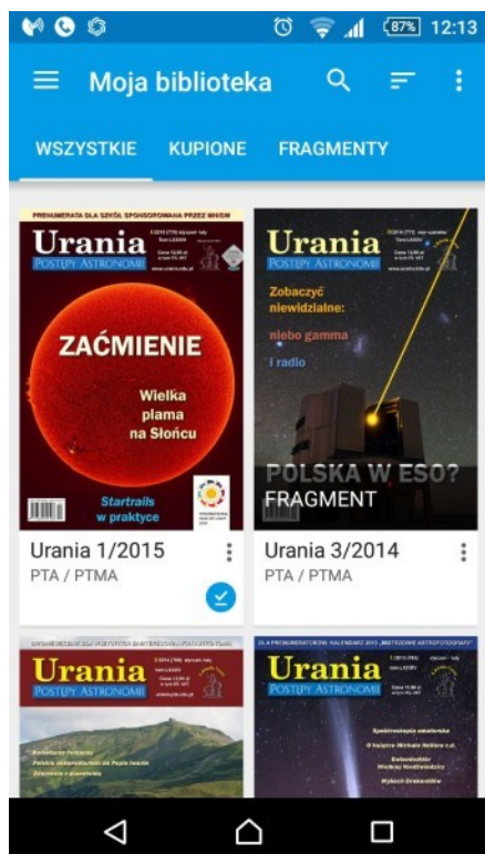
„Urania” w Książkach Google – widok na smartfonie.