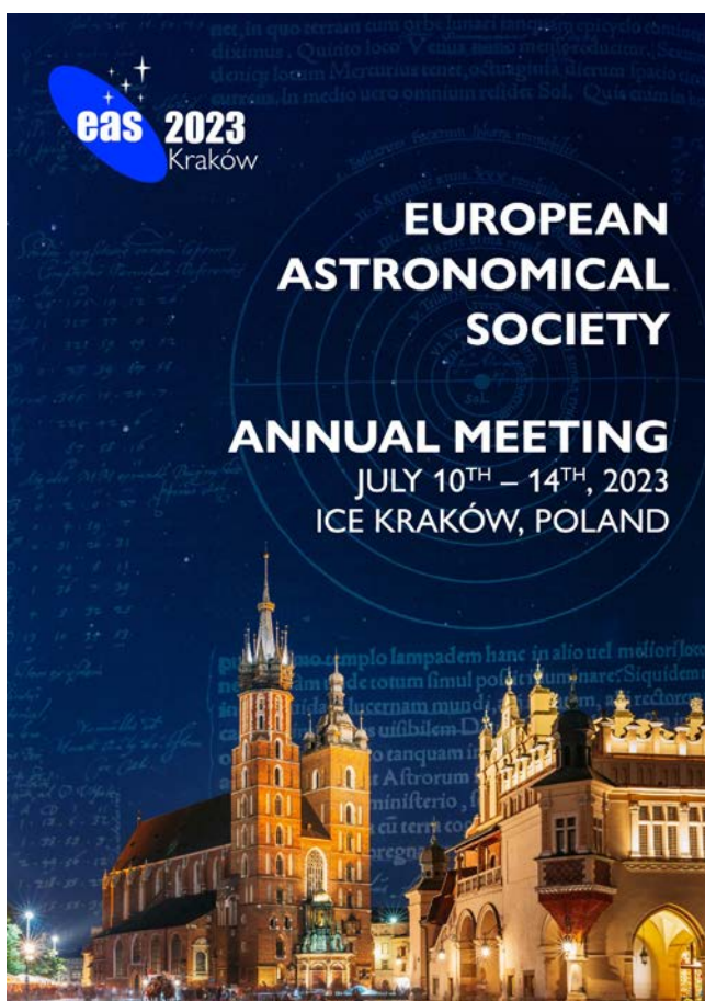
Plakat konferencji EAS 2023 w Krakowie.